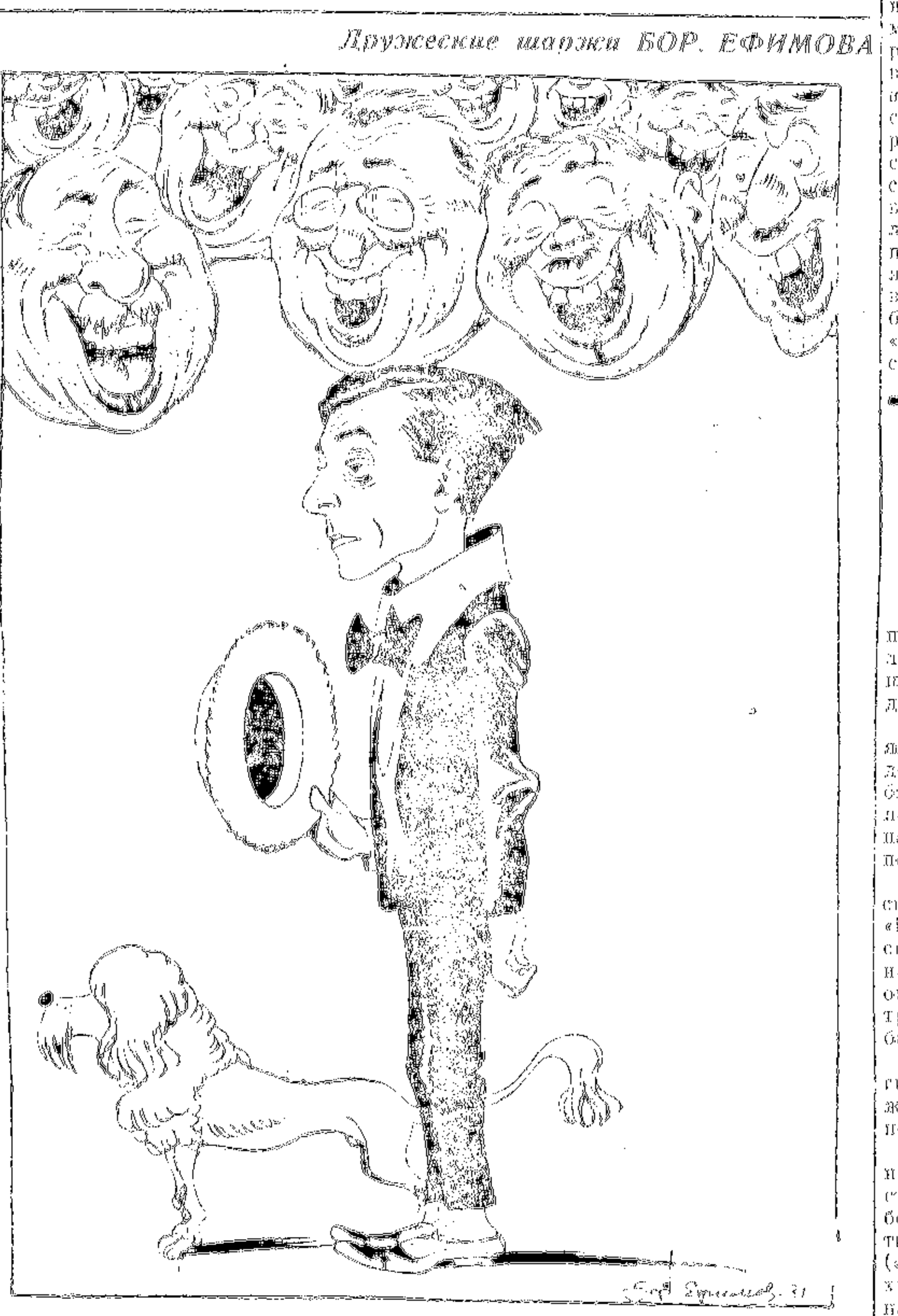
Зощенко. Из книги шаржей Бор. Ефимова и пародий Анибаха, составленной в изд-ве МТИ

ЛЕНИНГРАД (По телеграфу от наш. корр.). Вчера состоялось общегородское собрание писателей и литераторов. На массовом собрании после доклада пленума всезнающая оргкомитет разрешила все вопросы, связанные с решением пленума. Собрание полностью одобрило решения пленума.