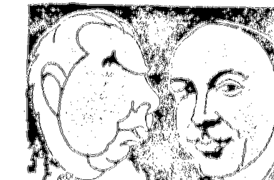
Саражи Амер. Худ. Саражи